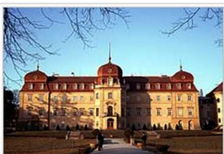
Poslanci ČNR se návrhem Ústavy zabývali v prosinci 1992 v Lánech

V týdnu od 19. do 24. října 1992 se v Karlových Varech začala připravovat čistá verze Ústavy.