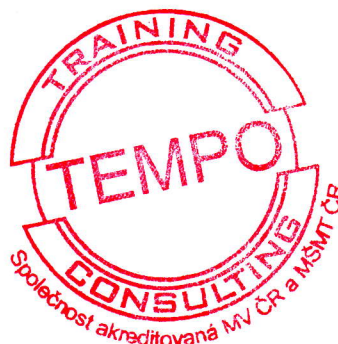
Jaroslav Uhlárik statutární zástupce vzdělávacího zařízení, na základě plné moci